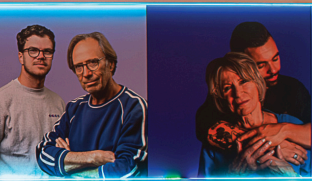
CULTUURCENTRUM De Kimpel & Ter Kommen